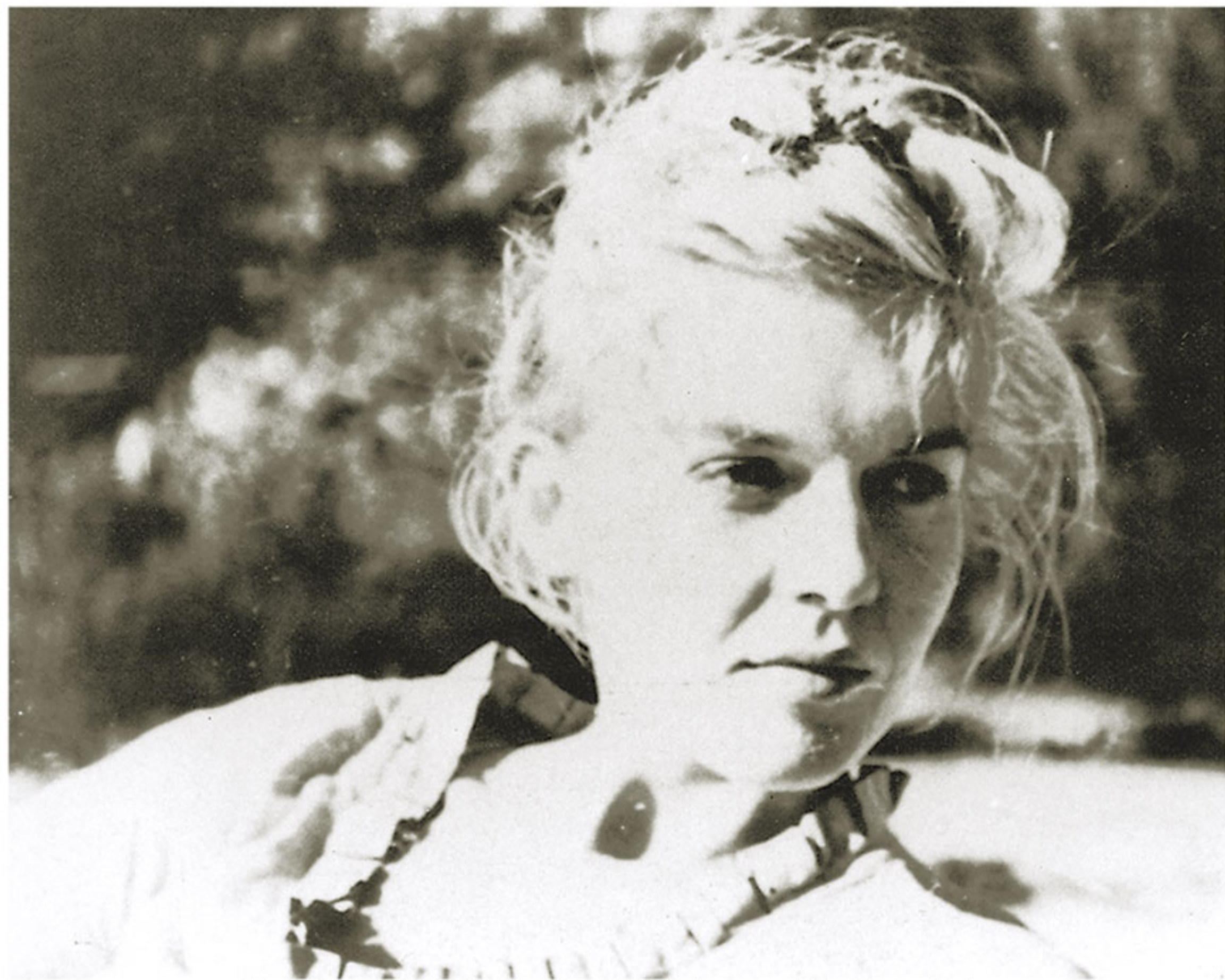
Elizabeth Smart en California, después de haber conocido a George Barker

Fortaleza, resistencia y simpatía (y belleza) mediante, Elizabeth llegó a conocer al poeta, que resultó estar casado y que, como ella, vivía más o menos libremente su sexualidad. Primero le ayudó económicamente en la distancia y manteniendo con-